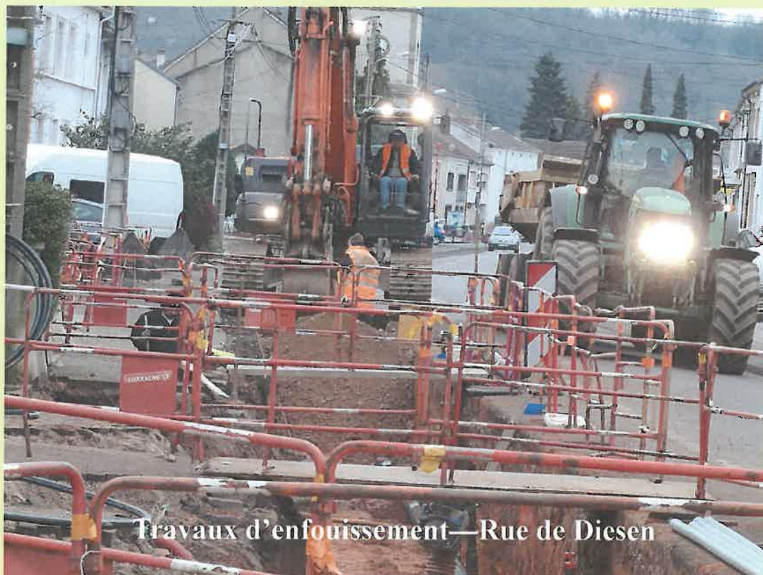
Travaux d'enfouissement—Rue de Diesen